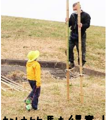
おひなは竹馬も得意！

昔遊びの達人「おひな」がやってくる！ダイナミックな土手すべりや宝をうばいあう昔のあそび「Sケン」は毎年大人気！！こま回しが得意な子も集まれ！