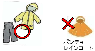
ポンチョ レインコート